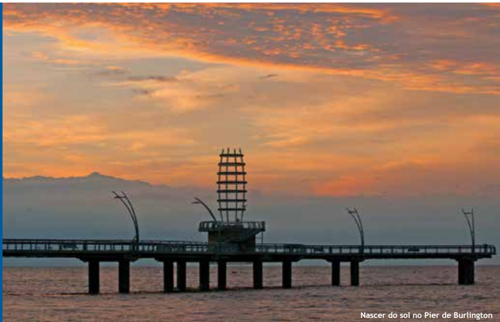
Nascer do sol no Pier de Burlington

De modo geral, o clima em Burlington é continental, com verões quentes e úmidos e invernos frios e secos. As condições são amenizadas devido a proximidade do Lago Ontário, que tende a reduzir os picos de temperatura. Por mês, as temperaturas mais altas estão entre os 27 graus em julho e zero em janeiro. A precipitação anual é de 711 mm de chuva e 1.295 mm de neve.