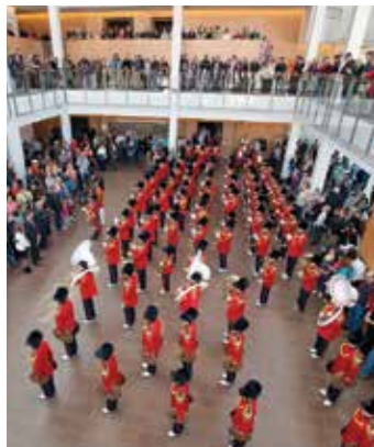
Burlington Teen Tour Band no Centro de Arte Dramática e Musical de Burlington