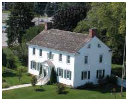
Museu Joseph Brant - Blimp Pics

O período agrário de nossa história foi marcado por atividades que já não existem mais. Fábricas de conservas comerciais, colheita de gelo e fábricas de cestos foram substituídas por empresas modernas e indústrias de tecnologia avançada, que atraíram novos moradores. Desde a visita de LaSalle a esta região há 300 anos, Burlington cresceu e se tornou uma região urbana muito bem-sucedida com uma qualidade de vida muito atrativa.