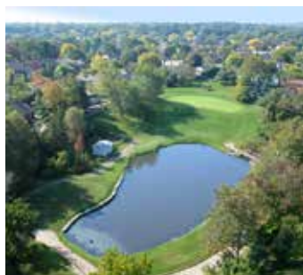
Campo Municipal de Golfe Tyandaga