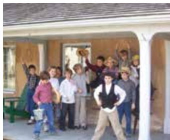
Casa Irlandesa na Fazenda Oakridge