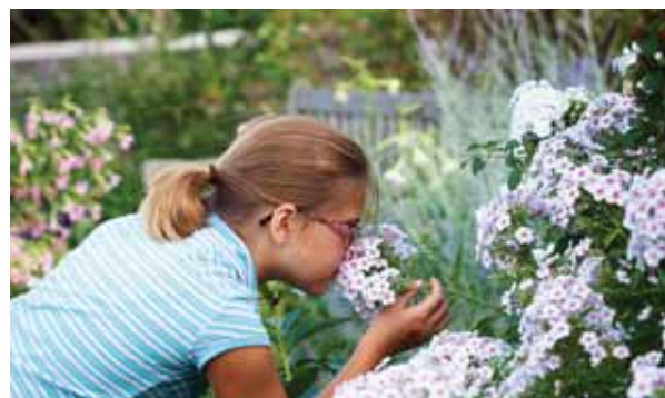
Jardins botaniques royaux - Daniel Banko

Fort de sa passion pour les arts, Burlington abrite un tout nouveau centre des arts d'interprétation, des musées d'histoire et une galerie d'art de première qualité. Les familles peuvent se divertir à bas prix en suivant une route panoramique et en s'arrêtant à l'une des nombreuses attractions touristiques locales, telles que les jardins botaniques royaux, le secteur riverain, le Centre d'art, les musées, le parc provincial Bronte Creek et les aires de conservation Halton. Grâce à ses nombreuses attractions amusantes, pittoresques et abordables, Burlington est la destination idéale pour tous, en famille ou en solo.