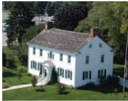
Musée Joseph Brant

Cette période agraire de notre histoire a été marquée par des activités aujourd'hui disparues. Les conserveries commerciales, l'entreposage de glace et les usines de fabrication de paniers ont été remplacés par des entreprises modernes et des industries de haute technologie, ayant amené avec elles bon nombre de nouveaux résidents. Depuis la visite de LaSalle il y a plus de 300 ans, Burlington est devenue une communauté urbaine prospère, offrant une excellente qualité de vie.