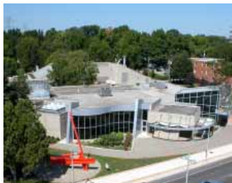
Burlington Art Centre