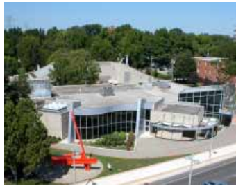
Burlington Art Centre : Blimp Pics