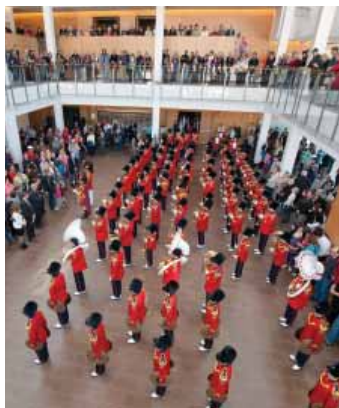
Teen Tour Band au Burlington Performing Arts Centre