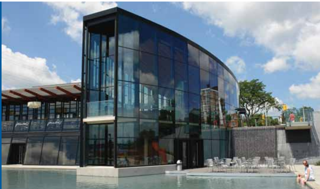
Discovery Landing : David Whale

Burlington profite généralement d'un climat continental, avec des étés chauds et humides et des hivers froids et secs. Cela s'explique par la proximité du lac Ontario, qui permet de réduire l'incidence de températures extrêmes. Les températures les plus hautes vont de 27 °C en juillet à 0 °C en janvier. Burlington reçoit en moyenne 71 cm (28 po) de pluie et 130 cm (51 po) de neige annuellement.