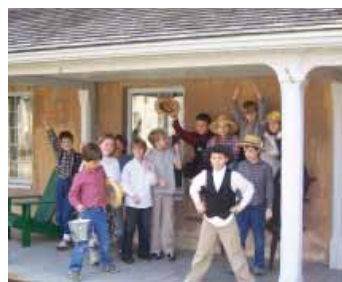
Ireland House at Oakridge Farm