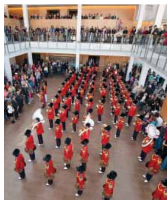
Burlington Teen Tour Band al Centro per le arti dello spettacolo di Burlington