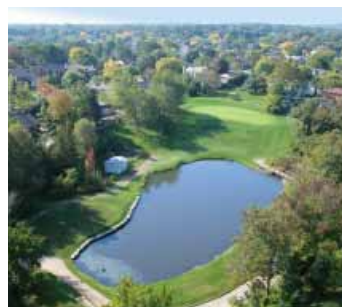
Campo da golf comunale di Tyandaga