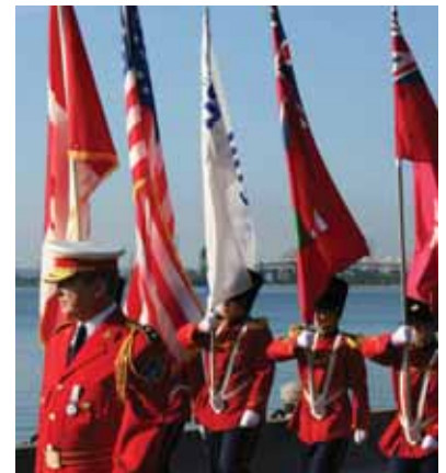
Burlington Teen Tour Band