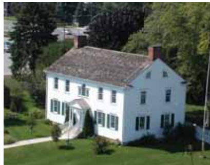
Joseph Brant Museum: Blimp Pics

Il periodo rurale della storia di Burlington fu segnato dalla presenza di attività adesso scomparse. Aziende moderne e imprese ad alta tecnologia hanno preso il posto degli antichi conservifici commerciali, delle aree per la raccolta del ghiaccio e delle fabbriche di ceste, provocando un notevole afflusso di residenti. Dall'arrivo di LaSalle in questa zona (circa 300 anni fa), Burlington si è evoluta diventando un'area urbana molto apprezzata in grado di offrire una qualità della vita di alto livello.