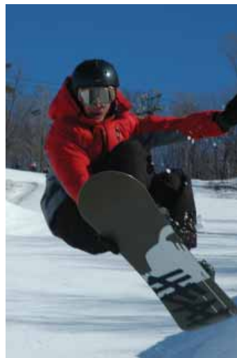
Snowboarding al Glen Eden